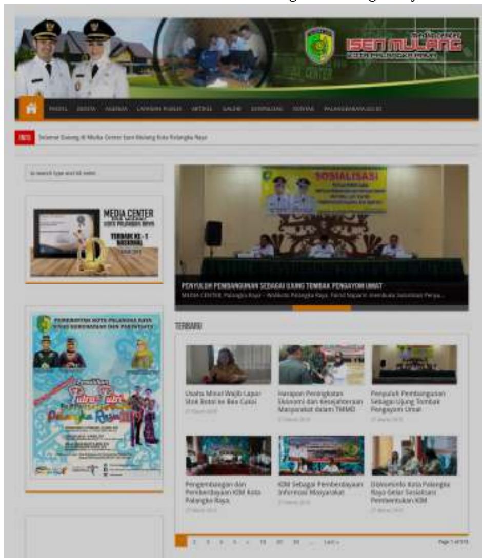
Gambar 6. Website Media Center Isen Mulang Kota Palangka Raya

Dengan adanya website milik pemerintah dapat dengan mudah memberikan informasi yang cepat kepada masyarakat tanpa dibatasi dengan ruang dan waktu, namun informasi yang disampaikan tersebut tentunya harus Up to date.